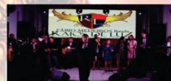
Ministério de Louvor Raio de Luz