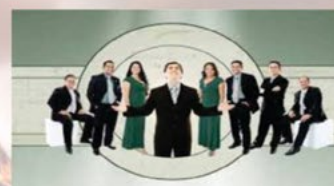
Ministério Diante Do Rei Jesus