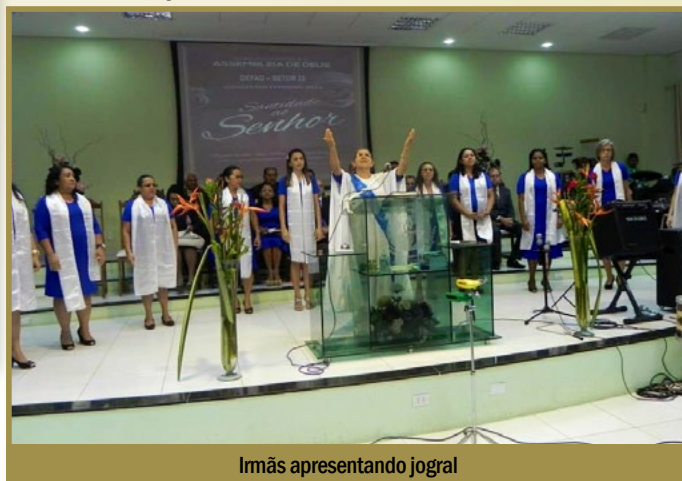
Irmãs apresentando jogral

pírito Santo nos alegrando e renovando nossas forças para continuarmos firmes e constantes na obra do Senhor.