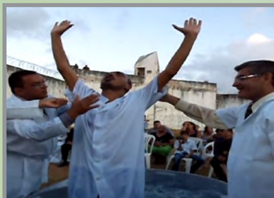
Momento do Batismo em águas

“Foi o Senhor quem fez isto e é coisa maravilhosa aos nossos olhos” (Sl.118.23)