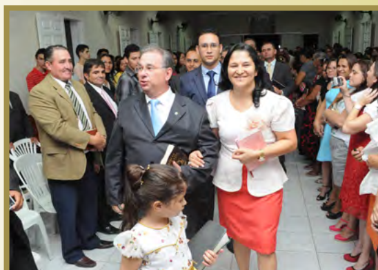
Igreja em Caraúbas recebeu com alegria a nova família pastoral